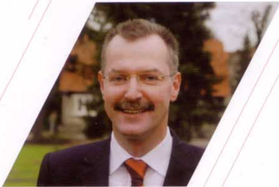
Benedikt Ruhmüller Bürgermeister